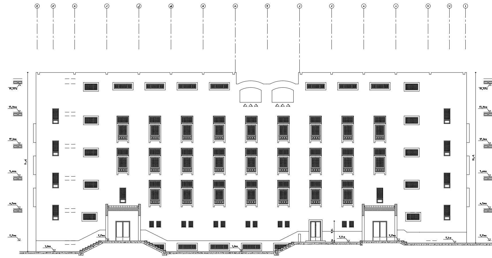
الواجهة الخلفية ٣ / ١٤